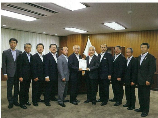
五月三十一日(木)中核市議会議長の代表者と復興庁を訪問した根本幸典氏は、吉野正芳復興大臣に東北地方の復興について要望活動を行なった