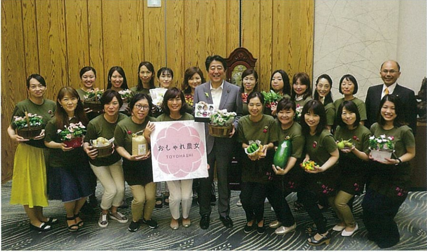
安倍晋三内閣総理大臣に豊橋市で採れた安心安全な農産物をPRするおしゃれ農女と根本幸典氏